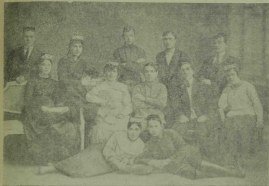
Перьда кызылармеецлар һәм эшчеләр клубы каршындагы труппа артистларынан бер төркөм 1 .

на беренче бөтөндөнья сугышы вакыйгаларын эченә алган бу эсәр ярыйсы гына көчле язылганлыктан, күп мәртәбәләр кабатланып, сезонда уңышлы спектакльләренң берсе булды.