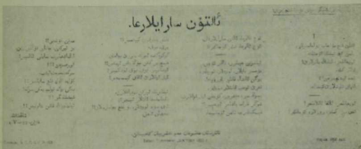
h. Такташ бастырып чыгарган листовка. Андагы шигырьне 92 нче биттән уку.