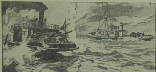
И. Язынин линогравюралары.

урнашкан миноносец «Прыткий» ерак та түгел инде, кыен хэлгә элэккән «Ваня — коммунист»ны буксирга алмакчы. Эмма ул өзлексез явып торган дошман уты аша үтөп, яраланган корабка ярдәм итә алмады. Үзе чак кына һәлак булмыйча, кире чигенде.