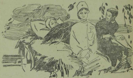
Х. Әхмәтжанов рәсемнәре.

Беркадәр вакыт кызу гына бардык та, хатын тагын ухылдарга тотынды.