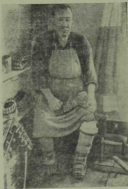
Чабата ясаучы татар карты, Х. Әхмәтшин өше.