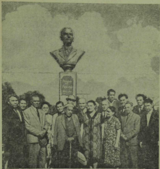
Шагыйрьнең Тукай-Кырлай авылындагы һәйкәле янында кунаклар.