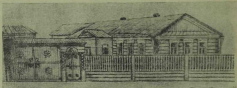
Музей бинасының тышкы күренеше.