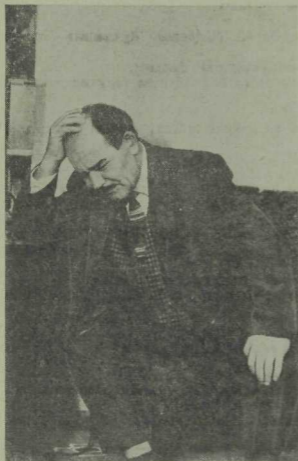
Габдрахман — РСФСРның атказанган, ТАССРның халык артисты Нәҗип Гайнуллин.

Габдрахман (тәмам жебеп төшә). Белсән, минем артган өйгә килмиләр.