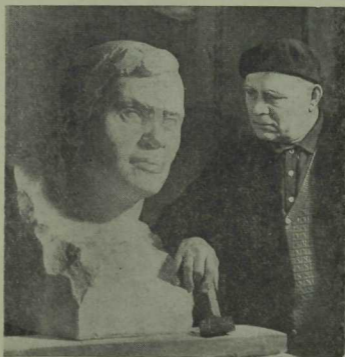
Скульптор Муса бюстын ясаганда.

— Мин башта таш идем. Скульптор мастерскоенда бюстка әйлән-