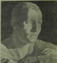
Г. Тукай (мәрмәр).