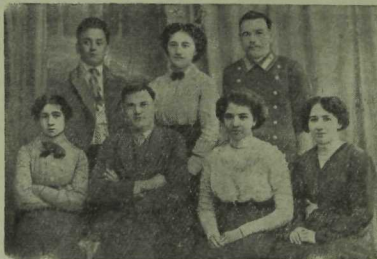
«Шимбә» түгәрәге членнарыннан бер төркем.