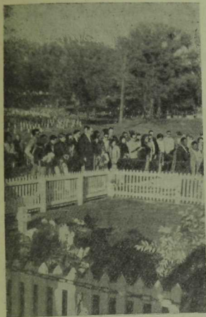
Кеннеди кабере янында.

лек түгелде. Болар турында күп яздылар. Барри Голдуотер сайлауларда жинелсә дә, үзенең фашистик карашларын ачыктан-ачык һәм күп мәртәбәләр белдергән бу кешене яклап 26 миллион америкалы тавыш бирде. Әлбәттә, ул вакытта газеталар язганча, 26 миллион кешенең барысы да бу психопат күз алдында тоткан политик курсны якламадылар. Бик күпләр республикачылар кандидаты өчен семья традицияләре буенча гына тавыш бирделәр.