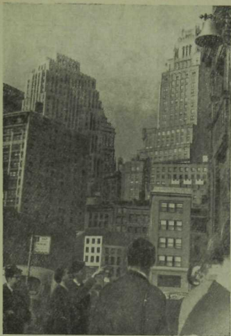
Филадельфия шәһәре күренеше.

Филадельфиядә без Линдон Джонсонны күрдөк. Булачак президент туктарга тиешле «Континенталь» отеле тирәсендәге урамнар кичтән халык белән тулы иде. Халыкның яртысы негрлардан гыйбарәт иде. Түбәләренә әйләнә торган фонарьлар куелган полиция машиналары төрле якка өзлексез йөрөп торды. Башларына ак каскалар кигән «эмердженс полис» («гадәттән тыш полиция агентлары») рәте халыкны уртага үткәрмичә тоткарлап тора иде. Полиция вертолеты шул тирәдәге йортларның түбәләрен прожектор белән өзлексез яктырта — Далластагы хәлнең (Кеннединең үтерелүе) тагын кабатлануы мөмкин бит!