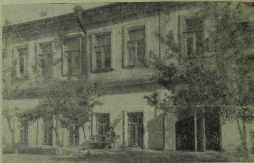
6 нчы рәсем.