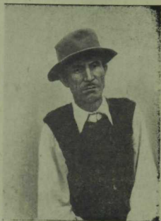
4 нче рәсем.