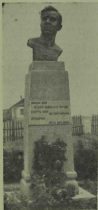
1 иче рәсем.

Ләкин турылыклы һәм хәйлә-алдауны белмәгән Мостафа абый яхшы сәүдәгәр булып китә алмый. Күпме генә тырышса да аның сәүдә эшләре һаман кирегә тәгәри барган. Хәтта байдан вексель белән алган акчасын да кайтара алмагач, бурычын түләмәгән өчен, Мостафа абыйны 2—3