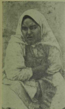
3 нче рәсем.