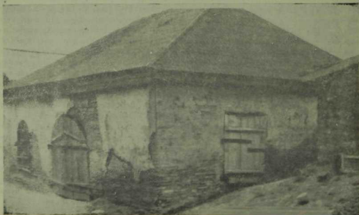
2 иче рәсем.