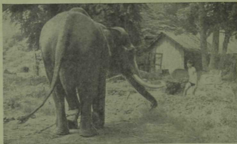
Король сарае ишек алдында фил.

Матур болыннар һәм көтүлекләр, елгалар һәм күлләр, кечкенә-кечкенә авыллар аша узып, автобус Сиам култыгына да килеп җитте. Эссе һава, ерак юл шактый талчыктырган, сусаганбыз. Тизрәк арыган тәннәргә хәл кертсә кирәк. Безне алдан ук, су кергәндә күлмәкләрне салырга ярамый дип, кисәтеп куйганнар иде. Без игътибар итеп тормадык. Бүген көн болытлы бит, нәрсә булсын, янәсе. Бу юләрлегебез шактый кыйммәткә төште. Төне бие авырып, әрнәшәп чыктык — без тәннәргә пешергәнбез. Ярый инде, икенче юлы акыллырак булырбыз.