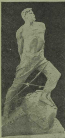
Муса Жәлил. В. Е. Цигаль скульптурасы (проект).

ланганнар. Уйлыым, бу бит дим, хәзинә, сирәк очрый торган хәзинә. Тагын шунысы күнелне дулкынландыра: фашистлар зинданында үлем көтөп яткан хәлдә дә шагыйрь чын немецлар белән гитлерчылар арасындагы аерманы күрдән туктамаган. Бу — иски-тәрлек факт. Чыннан да. Әйттик, Эрих Вейнерт үзенең сугыш башланыр алдынан язылган бер поэмасында «чын немец» һәм Гитлер иярчененә әверелгән «немец» турында яза икән һәм ул әлеге ике немецны бер-беренә каршы куеп, тыйбрәтле контраст тудыра икән — бу безнең өчен үзеннән-үзе аңлашыла торган нәрсә.