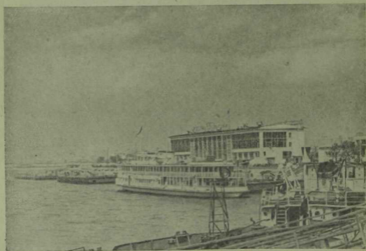
Казан. Елга порты.