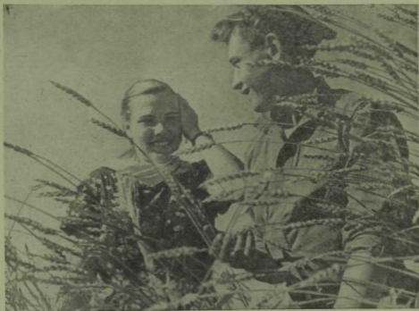
Яңадан — туган якларда.

Ихтимал, РСФСРда фоторепортер Ф. Абдуллин аяк басмаган һәм ул рәсемгә төшермәгән почмак юктыр. Менә шуңа күрә дә Ф. Абдуллин фоторәсемнәренең тематикасы бик күп төрле һәм «Татарстан» кинотеатрына килгән тамашачылар аның рәсемнәрен кызыксынып карадылар. Журналыбызның бу санында без Ф. Абдуллинның күргәзмәгә куелган дүрт рәсемен урнаштырабыз һәм якташыбызга киләчәктә тагын да зуррак уңышлар теләп калабыз.