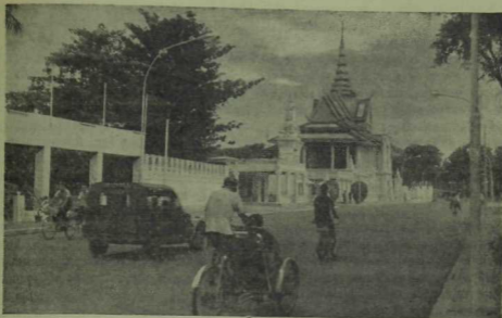
Пном-Пеньдә король сарае.

Шәһәрнең бу районында власть органнары, төрле учреждениеләр урнашкан, Камбоджадагы СССР илчелеге бинасы да шул урамда.