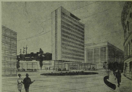
Куйбышев майданында салыначак «Үзәк» гостиница проекты.

Казан шәһәренең үсешә һәр яктан уйлап эшкәртелгән, фәнни нигезләнгән генеральный план нигезендә алып барыла. Бу план шәһәрләрне проектлау буенча Ленинград институтының («Ленгипрогор») талантлы ижади коллективы тарафыннан төзелде. Шәһәрнең гомуми генеральный планы башкалабызның спецификасы, аның тарихи формалашкан үзенчәлекләрен исәпкә алып төзелгән. Анда хәзерге архитектура, шулай ук төзелеш фәннең һәм техникасының казанышлары, ысуллары белән шәһәрне яңарту да күз алдында тотыла.