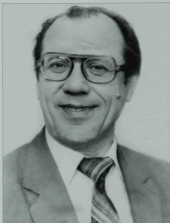
Шәүкәт Галиев (1928 – 2011)