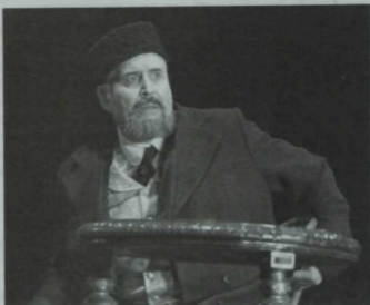
«Гөлҗамал» (Н.Исәнбәт) спектаклендә Исмаев ролендә.

Искәндәр Хайруллинның эшләве ошый мина: белеме, әти-әнисе аша геннардан күчкән таланты бар, ул театры һәр күзәнәгенә сәндәргән кеше. Шуның өстенә, биреләп эшли, эзләнә. Һәр репетициягә яна идеяләр, фикерләр белән килә. «Хан кызы Турандык» спектаклен әзерләгәндә, Искәндәр Кытай режиссёры Ма Джен Хонг белән бик еш һәм озаклап бәхәсләше илде, аларның карашлары, фикерләре туры килмәгән урыннар күп