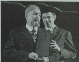
«Курчак туге» (Г.Исхакый) спектакльнедә Гайни бай ролендә.

Шуна «халык моны кабул итәчәк, ә монысын – юк» дигәндә, бик сак булырга кирәк: халык фикере төп критерий түгел. Халык менә дигән спектакльне дә кабул итмәскә, яратып китмәскә мөмкин. Шул ук вакытта, әллә ни зәвыклы булмаган тамашага йөрмичәк. Әлбәттә, театр тамашачыдан башка да яши алмый. Ләкин репертуарны тамашачы зәвыгына карап кына төзү – сәнгати яктан дөрес юл булмаячак. Тамашачы фикеренә таянырга кирәк, ләкин ана буйсынырга, иярергә ярамый, дип саныйм мин.