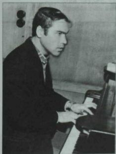
Композитор Ренат Еникеев. Үткән гасырның 80нче еллари.