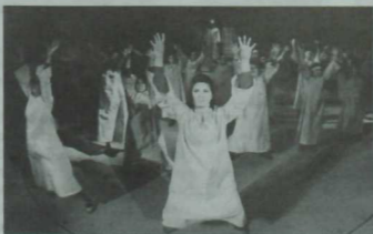
Н.Фоттах. «Итил суы ака торур».