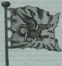
Казан ханлыгы флагы. Әлеге сурәт Карлус Алярдың 1705 елда Амстердамда басылган һәм 1709 елда рус теленә тәрҗемә ителгән китабында бирелгән.

Димәк, телчеләреннән мондый нәтижеләре легенда-риваятьтәге Бараж еланының кимак-кыпчакларны гәүдәләндерүе турындагы безнең карашны тагын да нигезләрәк, ышанычлырак итә. Безнең караш исә, үз чиратында, телчеләреннән нәтижеләрен куәтли. Дөрөс, әлеге галимнәреннән концепциясендә без килешми торган эклектизм элементлары, нигезсез фаразлар да юк түгел. Мәсәлән, Р.Г.Әхмәтжановның «татар