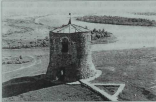
Алабуга каласындагы мәчет-кальганың бүгенге көннәргә кадәр сакланып калган манарасы. Уң якта өчпочмак рәвешендә мәчетнең михраб урыны.

Һәм әйтергә кирәк: Пермь һәм Чиләбе өлкәләрендәгә Алабуга дип йөртелүче күдләр дә үз атамаларын, һичшиксез, суларында шул исемдәгә балык булуына карап алынган булырга тиеш. Ә менә сулыкның түгел, ә Кама буендагы шәһәрнен балык исеме белән аталуы аек акылга сыймый. Шуна күрә дә без «Алабуга»ны кушма исем итеп карыйбыз да һәм географик атамаларның мотлак рәвештә тарихи чынбарлык белән ярашырга тиешлегеннән чыгып, әлегә сүзнен икенче яртысын да жирле фактлар белән бәйләү — иң дөрес юл дип исәплибез.