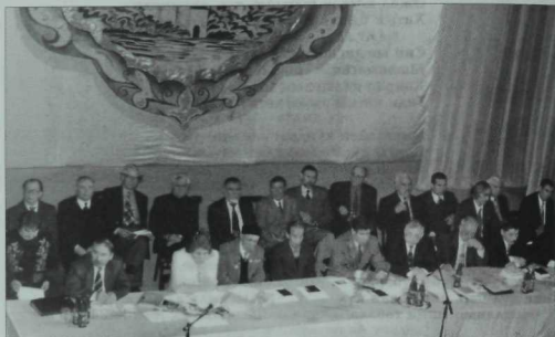
Татарстан язучыларының XIV съезды президиумы күренише. 2002 ел, май.