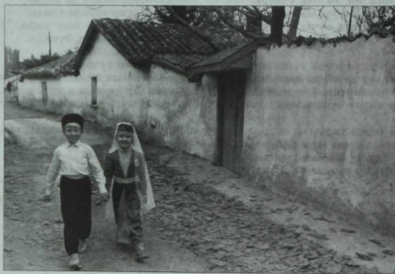
Кырым эфиренең киләчәк хужалары. Карасубазар.