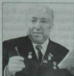
Рәсул Гамзатов. Казан 90нчы еллар.