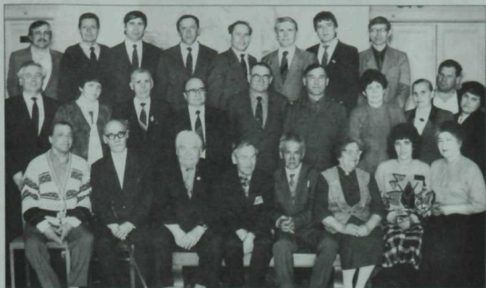
Әлмәт төбәге якларында яшәп иҗат итүче язучылардан бер төркем. Бу фото 1994 елның апрель аенда төшерелгән. Арада вафат булганнары да шактый, шөкер, бүген дә исән-имин иҗат итүчеләр дә бар.