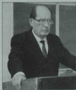
Татарстан фәннәр академиясенең беренче президенты Мансур Хасанов (1930—2010).