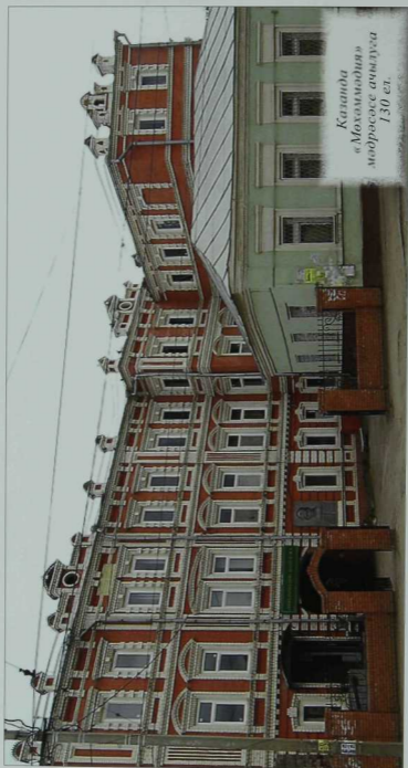
Казанда «Мохолмадина» мадрәсәсе ачылуға 130 ел.