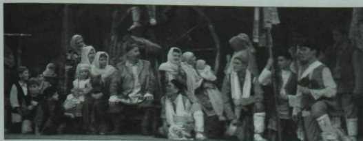
«Зәңгәр шәл» спектакленән бер күренеш.