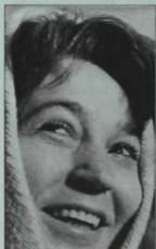
Татарстанның халык артисткасы Асия Галиева. 70нче елларда алынган рәсем.