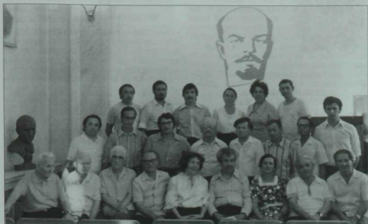
Шагыйрь Мостай Кәрим белән Тукай клубында очрашу. Фотоны иҗтибар белән караганда бик күп язучыларны һәм сәнгать эшлеклеләрен танып була. Казан. 1977 ел.