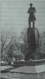
Боек шагъйрь һәйкәле янында шигърь бәйрәмнәре еш уза иде