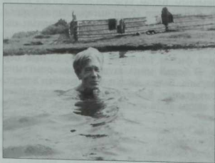
Шагъйрь Хәсән Туған (1900–1981) дулкыннар хозурында. 70нче еллар.