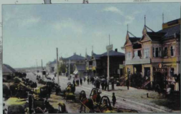
XX гасыр башында алынган фотосурәتلәр.