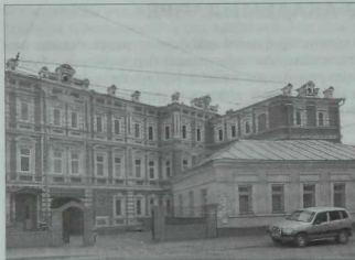
«Махаммәдия» мәдрәсәсе бинасы. Казан, Тукай урамы, 34нче йорт.

Мәдрәсәдә укыган чорда Г.Ибраһимов, Г.Нигъмәти, Ж.Валидиләргә дини белемнәр системасы аша рухи-әхлакый тәрбия бирелгән. Бу урында шуны да билгеләп үтик, 1920-1930 елларда актив эшчәнлек алып барган Ж.Валиди, Г.Нигъмәтиләрнең һәм