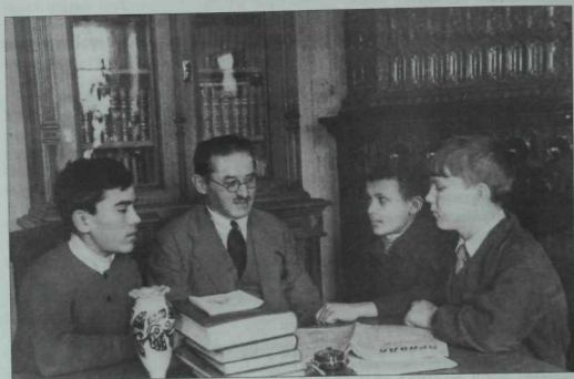
Язучы Шәриф Камал үзенең эш бүлмәсендә укучы яшлар белән бергә. 1939 ел.