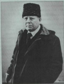
Рәссам, сынчы Бакый Урманче (1897-1990). 1981 елда төшерелгән фоторәсем.