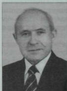
Г а р и ф ж а н М ө х ә м м ә т ш и н