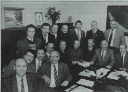
"Казан утлары" журналының редколлегия утырышынан соң. 1998 ел.