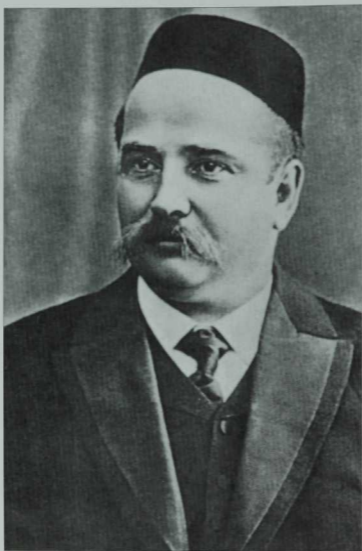
Галиясгар Камал (1879–1933)