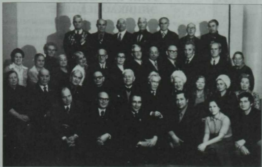
Татарстан радиосы ветераннары. 1977 ел.