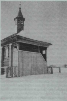
Чуртанлы авылы мөчете

Дин белән дә шундыйрак хәл—мәчет бар, әмма мулла юк, аны гаелләрдә