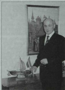
Илче Назиф Мириханов – Татарстан Республикасының Россия федерациясендәге тулы вәкәләтле вәкиле. “Казан утлары” журналының редколлегия ағзасы. 2006 ел.