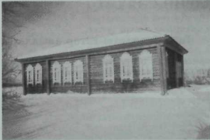
Тарлар авылы клубы

Безне клуб янына китереп бушаттылар, клуб дигәннәре агач бер йорт булып чыкты, элек ул мәктәп булып торган. Уч төбе хатле генә сәхнәсе бар икән, киенү-чышенү бүлмәсенә “Умырзая”ның егермәләп артисты кереп тулды, мин чиста итеп юылган авыл клубының бер башында ялгызым гына намазларымны укып алдым. Аннан урамга чыгып, концертка кадәр авыл белән таныштым. Авыл шактый кечкенә булып чыкты, анда йөзләп кеңә кеше яши икән, мәктәп тә, мечет тә юк. Балалар мәктәпкә күрше урыс авылына йөриләр, ә кеше үлсә жәназа укырга мулланы Омск өлкәсенә Тазлар авылынан алып киләләр икән. Әлбәттә,