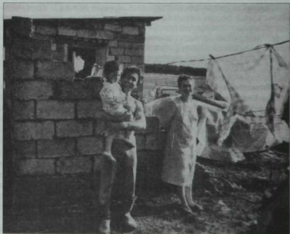
Туған илдә нигез корабыз! Сорғеннән Кыргызга кайткан яшь гайлә. 90 нчы еллар.