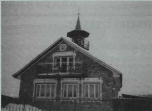
Олы Уыш авылы мәчете.