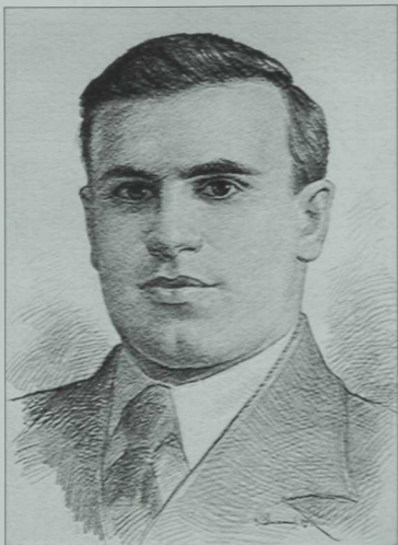
Абдулла Алиш (1908–1944)