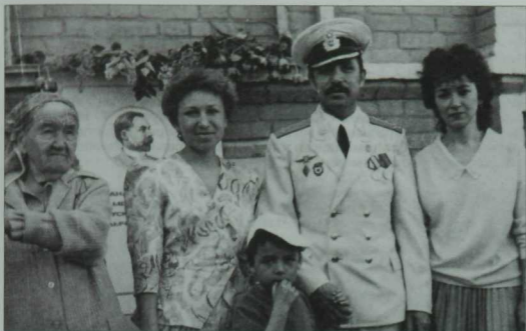
1989 елда Оренбургта Дәрдемәнд яшәгән йорт диварына истәлек тактасы куела. Рәсемдә – шагыйрьнең нәсәл дөвамчылары.