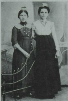
Сердәш тутаулар. 1915 елгы фото.