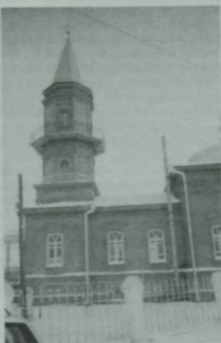
Тубыл шәһәре мәчете.