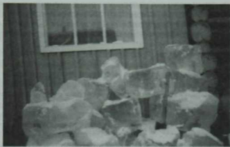
Лайтамак авылы кешеләре шушы бозны эртеп эчә.

Тубылдан 70-80 чакрым ераклыкта, көнбатышка таба, тоташ сазлыklar эчендә утырган бер татар авылы бар, ул Лайтамак, дип атала. Жәен монда бернинди юл юк, очкыч белән генә килергә мөмкин, ә кышларын чана юлыннан йериләр. Халык сөйләвенчә, татарлар көчләп чукиндырудан качып шушы сазлыklar арасына барып урнашканнар, шул ук вакытта авылның бик борынгы булуын, Алыплар