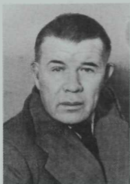
Татар филологиясе үсешенә зур өлеш керткән галим Латыйф Жәләй (1894–1966).