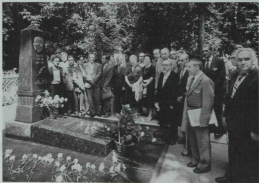
Тукай кабере янында. Апрель, 1986 ел.