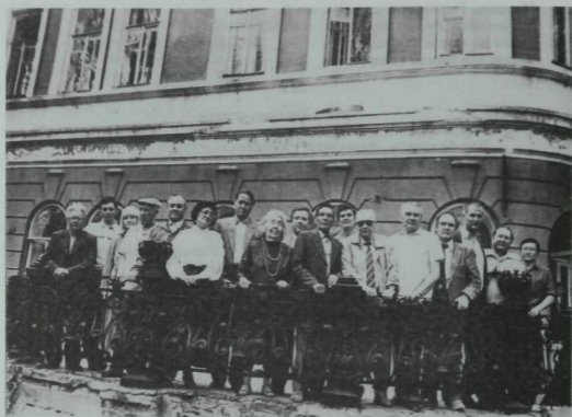
Төрле буын язучыларының бер төркем Татарстан Язучылар берлеге бинасының бакчага чыга торган болдырында. 1996 ел.