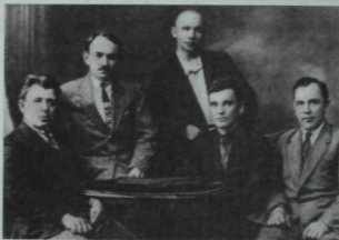
«Кызыл Татарстан» (1924—1951) редакциясе.

—Әйе. Иске өйне кемдер силләп котыла, кемдер янаны сала,—дидем. «Силләү—