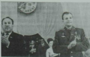
«Социалистик Татарстан»да чыккан фоторәсем. Казанның Спорт сарае. Беренче космонавт Юрий Гагарин. Р. К. Безяев белән. 1967 ел.

—Алар бер-берсенә тыгыз бәйләнгән... 90 яшьлек газетабызны традицияле, сыйфатлы, зәвыкы итеп саклап 100 яшенәчә житкәрәсебез кила. Эстрада тирәсенә укмашкан «сары матбугат» белән уртаклыгыбыз юк. Алар бит тираж арттыру өчен бүгенге эстраданың үзә кебек «арзанлы», оятсыз, тозсыз гайбәтләр язып халыкны матур әдәбияттан, зәвыкы сәнгатьтән аералар.