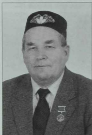
Фатир сораганда төштек инде Түрәләрең ишек төбенә.—

Бу Кеше каршында минем шактый унайсыз хәллә калганым бар, һәм шул унайсызлану тойгысы әле дә жанны тырнап тора. Минем хакка, авыр ачыла торган «калын ишек»ләреннән берсен ачып керергә, ә керер алдыннан, хужанын «бушавын» көтеп, кабул итү бүлмәсендә озак кына йоренергә туры килде ана. Артык сиздермәскә тырышып кына, уң кулы учын әледән-әле йөрәк турысына куеп ала. Анын, йөрәге борчып, күптән түгел генә хастаханәдә ятып чыкканын, аулак авылда яшәп белми калган идем шул, шуңлыктан ана—ул чагында Татарстан Язучылар берлегенән рәис урынбасары булган дустаныбыз Шаһинур Мостафинга—бер мәсьәләдә булышык сорап килүем вакытсызрак килеп чыкты. Инде менә, шул вакыйга искә төшкән саен, Шаһинурны бик якын иткән, бик күп әдәби сәфәрләрендә бергә йөргән, «гадәт-холкы белән кыр казы» булган мәрхүм Илдар Юзеевның, мондашы Фасил Әхмәткә багышлап язган бер шигыреннән: