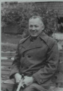
Композитор Фасил Әхмәтов (1935—98). 80 нче еллар рәсеме.