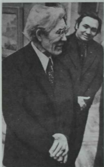
Шагыйрь Хәсән Туфан һәм рәссам Рәшит Имаинов. Үткән гасырның 70 нче еллар ахыры.