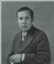
Илдус Ахунҗанов (1930—1990). Әдәбият тәнкыйтьчесе.