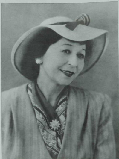
Сара Садыйкова (1906 –1986)