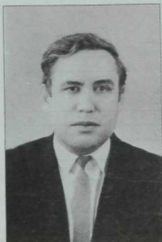
Нәфыйгов Рәфикъ Измаил улы (1928 — 2001) — күренекле галим, тарихчы. Журналыбызның даими авторы, 60-70 нче елларда редколлегия әгъзасы булып та торды.