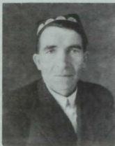
Тәнкыйтьче Гомәр Гали. «Атака» (1930), «Совет әдәбияты» (1933, 1935) журналларының баш мөхәррире булып эшләгән. 1949 елда алынган фото.