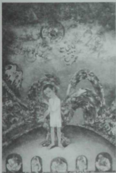
"Шагырьнең тууы". Рәссам А. Абзигитдин. 2001 ел.