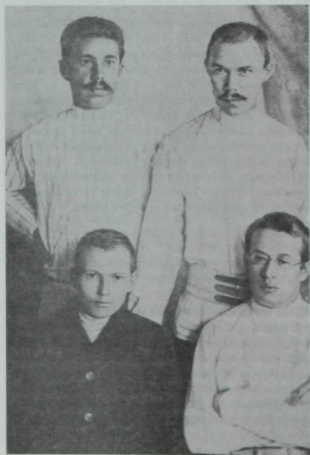
Сулдан, алгы рәттә: Г. Тукай, Ф. Әмирхан; басканнар: Г. Коләхметов, К. Коләхметов. 1912 ел.