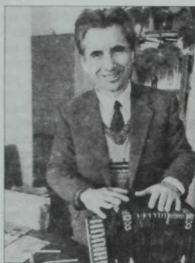
Балалар язучысы Жәүдәт Дәрзаман. 1995 ел.