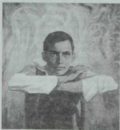
"Шагыйрь Г. Тукай", Рәссам Е. Симбирин, 1976 ел.