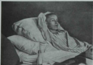
Г. Тукайның соңғы көннәре.