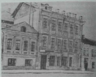
Казанда "Шәрәк" клубы урнашкан бина. (Хәзерге Татарстан урамы, 8 нче йорт.) 1910 нчы елның 15 апрелендә Г. Тукай үзенең "Халык әдәбияты" дигән лекциясен шушы клубта укыган.