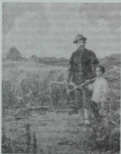
"Балэкэй Ануи һәм Сәғди абзый", Рәссам Л. Фәттахов, 1970 ел.