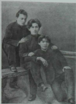
Сулдан: Г. Тукай, С. Рамиев, Ф. Азиев. 1908 ел.

Г. Тукайның 1908 елда балалар өчен чыгарылган “Жуаныч” исемле шигырьләр жыйнтыгының тышылыгы.