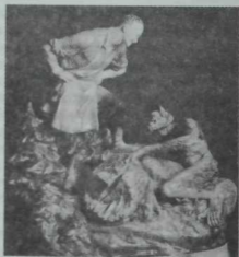
"Былыр һәм Шүрәле", Скульптор Г. Зиблицев, 1957 ел. Майолика.