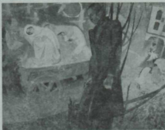
"Шагырь, Тәфтиләу". Рәссам И. Әхмәдиев. 1976 ел.