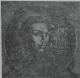
"Тукай һәм Шүрәле". А. Абзигитдин. 1976 ел. Керамика.