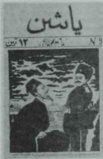
“Яшен” журналынын тышлыгы.

Беренче рус революциясеннән соң йөз ел үткәч, социализм жирлегендә шытып чыккан, бүгенгәчә исән-имин яшап калган сатирик журналыбыз һаман да шул бер “Чаян” дәфтәре генә. Анын каравы, сатира һәм юмор һәр тарафка таралды, коммунистлардан калган башка матбагаларнын хәтта беренче битенә (!) үк үтеп керде. Әйе, цензура бүген бөтенләй үк бетте кебек, ләкин социалистик диктатура үзенен варислары итеп һәр редакция саен өлкән пенсионерларын калдырды. Алар