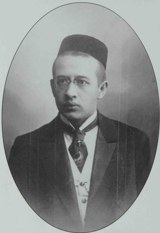
Фатих Эмирхан 1886—1926