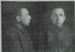
Кави Нәжминенң төрмәдә төшерелгән рәсеме. 1937 ел.