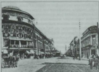
Пролетарская (хәзерге Бауман) урамы. XX йөз башы.

XX гасырның башларында Казан кискен социаль-сәяси каршылыклар мәйданына