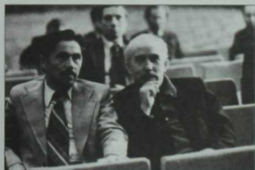
Кинорежиссер Харис Фәхрәтдинов һәм шагыйрь Марс Шабәев. Актаныш. 1978 ел.