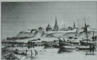
Казан Кремленең Казансу елгасы яғыннан күренеше. XVIII гасыр.

Әйе, Казан ханлығы чорында Казан каласы эре сәяси һәм административ үзәккә әверелә. Ул дәүләтнең югары хакимияте һәм ханнар резиденциясе булып санала. Алтын Урдадан мирас итеп алынган сәяси традицияләр, Шәрәк исламы шәһәрләренә хас рәвештә, яна сәясәт һәм хакимият оешмалары тууга китерә. Хакимиятнең иң югары баскычында хан һәм аның гаилә әгъзалары тора, алар Кырымны, Нугай Урдасын