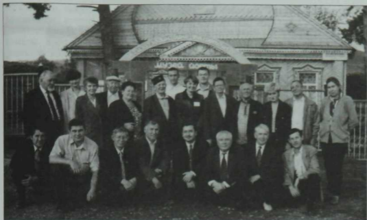
Казаннан килгән бер төркөм язучылар, галимнәр, мәдәният хезмәткәрләре Риза Фәхрәтдин музееңда, Әлмәт районының Кичүчат авылы. 2000 ел.