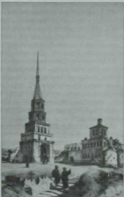
Соембикә манарасы. XIX гасыр.

Патша Казанга килгән чорда биредә инде аның фәрманы белән төзелгән казна һәм шәхси мануфактура фабрикалары гөрләп эшли. Дәүләтнен иминлеген саклау хәжәтеннән, Казансу елгасы арыгындагы Елантау монастыреннән жирләре тартып алынып, анда жылкәндә һәм башка төрлө кораблар ясау өчен Адмиралтейство оештырыла. Ул шәһәр сәнәгәте үсүгә зур этәргеч бирә, Елга арыягы (Заречье)