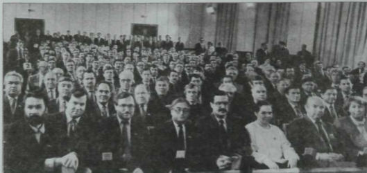
Республикабызның суверенитеты турында Декларация кабул иткән Татарстан халык депутатлары. 1990 ел.