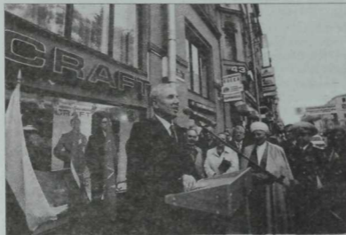
Санкт-Петербургда татар җәмәгатьчелеге белән очрашу. 2004 ел.

—Нишлисен, дәрәслекне яшереп яшәргә безнең вакыт калмаган. Тукаебыз әйткән бит әле: “Татар үлгәнме, әллә йоклаган гынамы?”—дип. Әйе, милләтебез кайда таркау, кайда көчсез, кайда—үлеп бара. Казаннан торып, безнең халык бөөк, дип, узган дәвәрләр белән мактанып ваемсыз яшәү жиңел дә бит. Ә урыннарда—аяусыз хакыйкаты ачыла... Без бит ничә дистә еллар буена үз Казаныбызда гына кайнап, республикадан ерактагы татарларга карата битараф хәлдә яшәдек, дәрәсрәге, рәсми идеология шулай яшәргә ойрәттә. Эчтән, йөрәктән борчылсак та араларыбызны якынайтырга мөмкинлекләребез юк иде. Шулай итеп, тутанлык жепләре өкрәнлөп өзәлә