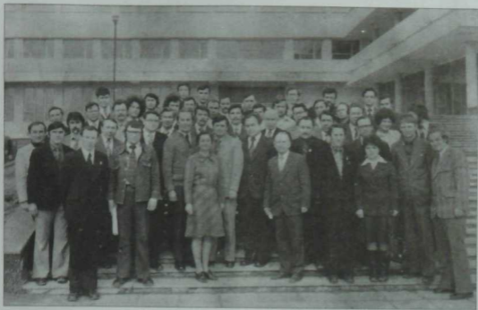
Үткән гасырның 70-80 нче елларында иҗтат яшьләренең семинарлары даими үткәрелә иде. Казан. Яшьләр үзәге. 1977 ел.