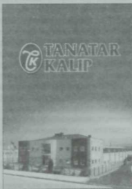
Ихсан Танатар заводы.