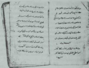
Ижевск шәһәрәндә табылган кулъязма.