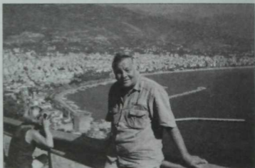
Күңелгә бик яқын бу җир... Төркия, кунакчыл Алаңия шәһәре.

бераз булса да иркен сулыш алыр. Бу көннәрне сез, яшьләр, шәт иншалла, күрерсез... Син төрки халыкларның бердәнбер мөстәкыйль дәүләте булган Төркиягә бару чарасын күр. Анда—Гаяз Исхакий, Садри Максуди, Йосыф Акчура кебек бөек милләттәшләребезнен каберләрен зиярәт кыл. Безнен мөһажирлеккә дучар булган туғаннарыбызны, дусларыбызны, бәлки, әле эзләп таба да алырсын...” Әтием аларның рәсемнәрен дә күрсәтеп, исемнәрен дә әйткән иде. Әлбәттә, әтибезнен бу сүzlәрен мин аның васыйте итеп озақ еллар сакладым.