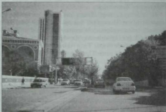
Анкара шәһәре күренеше.

Аркадашлар Истанбулнын жир астына урнашкан алтын эшкәртә торган заводларын да күрсәттеләр. Төркия дәүләтенен зур бер харитасын (картасын) барып карау да зур тәэсир калдырды. Бу күренешне төрек Диснейленды дип тә әйтәп була. Мондый эшнең тәрбияви әһәмияте бик зур, бигрәк тә яшь буын өчен, алар