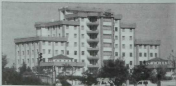
Иске шәһәрдәге балалар пансионаты.