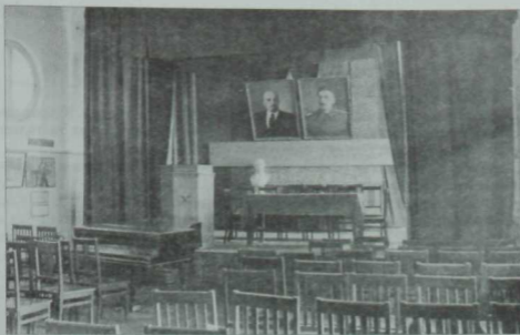
Язучыларның Матбугат йортында урнашкан (Бауман, 19) Туган исемендәге клубның эчкә күренеше. Ярты гасырдан артык дәвәрдә адипларның бергә-бергә жыйналышып фикер алыша торган үзгәч иде үз. Үткән гасырның 50 нче еллар фотосы.