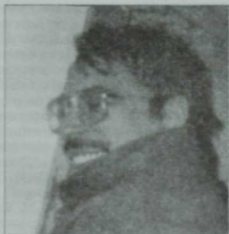
Скульптор Фарис Фәехи. 2001 ел.