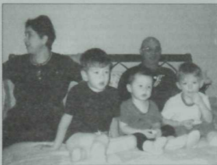
Оныклар барда шәжәрә өзәлмәс! 2005 ел.

Миннулла бабай бу сугышта башта разведка взводында була, “тел” алган өчен “Кызыл Йолдыз” ордены белән бүләкләнә (“Башына бер тондырдым, капчык кидердем, жилкәгә салдым да, кайтып житкәнче чаптым да чаптым”). Сталинныкыдай көттә мыеклы, озын буйлы, көчле-гайрәтле ир-ат иде бабай: Шуң озын бие аркасында чак кына теге дөньяга да китеп бармаган. Траншеядан иелпесыгылып йөрүдән гарык булып, бил ызып алыым дип тураюы була, снайпер пулясы уң янагынан кереп, юл унаенда азау тешләрен дә коеп, суң янагынан чыга. Госпитальдә ятканнан соң аны саперлар отделениесе командиры италәр. Отделение кыштаклардан жыелган, русча бер авыз сүз белмәгән үзбәкләрдән гыйбарәт була. Бабай боерыкларын татар телендә индерә. Төзиләр-сүтәләр, миналарны