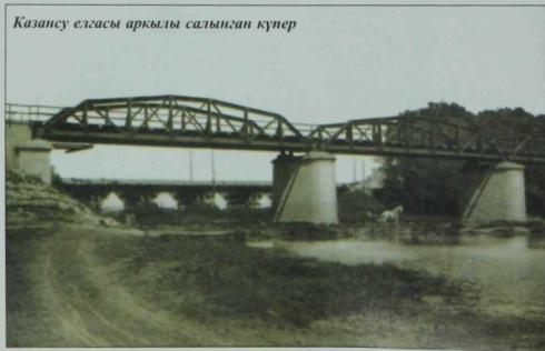
XX гасыр башында алынган фотосурәтләр.