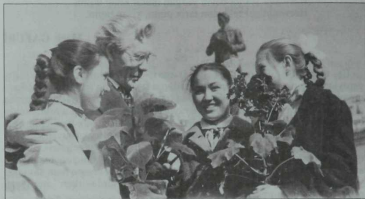
Шагыйрь Хәсән Туфан Тукай һәйкәле янында—Шилгәр бэйрәмәндә. 1965 ел, апрель.