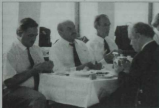
Хельсинкида татар жәмәгыятендә мәэжлестә. 2002 ел.

Элеккеге биш автономияле республика һәм унбиш өлкәдәгә татарлар яшәгән 900гә якын авылны тикшерү нәтижәсендә 9 мәннән артык кулъязма һәм мен ярымга якын иске басма китаплар жыела. Экспедицияләрен унышлы эшләве Казан дәүләт