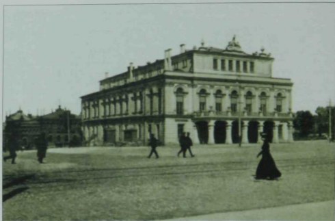
Хәзерге Ирек майданы урынындагы Казан шәһәр театры. XX гасыр башы.