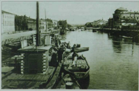
XX гасыр башы Болак күренеше.