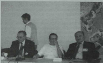
«Азатлык» радиосы редакциясендә.

Археографик экспедицияләрдә, архив һәм китапханәләрдә табылган кулъязмалар һәм 1917 елга кадәр дөнья күргән басмалар нигезендә М. Госманов тарафыннан XIX йөз татар әдәбияты классикалары Габделжәббар Кандалый, Мифтахетдин Акмуллаларнын әдәби мираслары тикшерелеп, төп оригиналдагыча бастырып чыгарылды. Бу хезмәтләрнен әдәбиятыбыз тарихы өчен никадәрле әһәмиятле икәнлеген аңлау өчен берничә мисал китереп узу да житәр. Мәсәлән, Г.Кандалыйнын 1960 елда басылган китабында 2500 юлдан артык шигъри текст дөнья күргән булса, М. Госманов тарафыннан төзелеп, 1988 елда чыккан басма 8500 юл чамасы текстын үз эченә ала. Бу — мәсәләнен бер ягы. Икенче яктан, Г. Кандалый, М. Акмулла