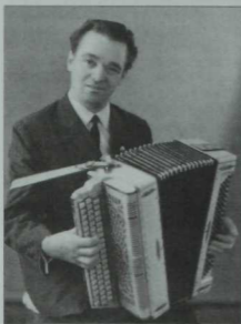
Үткән гасырның 50-70 елларында халык арасында популяр булган күп кенә жырлар авторы—композитор Фәтхерахман Әхмәдиев. 60 еллар фотосы.