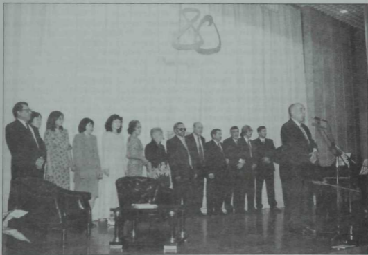
«Казан утлары» журналының 80 еллык юбилее уңаенан төшерелгән рәсем. Сәхнәдә—журнал коллективы. Казан милли мәдәнияте үзәге. 2002 ел.