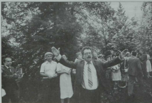
«Дуслар белән җырлар көчле яңгырый». Туфан Мирзүллин. Г. Тукайның тууына 100 ел тулу уңаенан Кырлай урманьында җыен. 1986 ел.