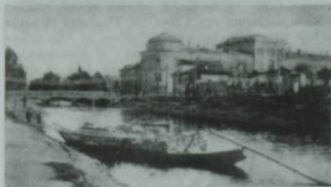
XX гасыр башында Болак

Казанлылар елганың хален даими күзәтеп торганнар: анын үзөнөн күп тапкырлар турайтканнар һәм тигеләгәннәр, яр буйларын чистартканнар һәм ныгытканнар. 1505 елда, Мөхәммәтәмин хан чорында, Болакның төбә һәм ярлары имән бүрәнәләргә төренә, ә моңа кадәр анын төбөнә таш жәелгән булган. Шуң исбәттән «Казан хәбәрләре» газетасы 1929 елда «Болак кушылдыгы борынгы заманнардан ук яшәп килгән ясалма канал», дигән нәтижә ясып.