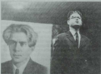
Сыркыдыда, Такташның 70 еллыгында чыгыш. 1971 ел.

Егерменче елларда тынгысыз Такташның әдәбиятка килүе олы вакыйга буларак кабул ителгән иде. Аның кебек үк, беренче адымнарыннан үзенә игътибарны жәлеп итәрлек шагыйрь күрүнгәнче, шактый озак көтәргә туры килде.