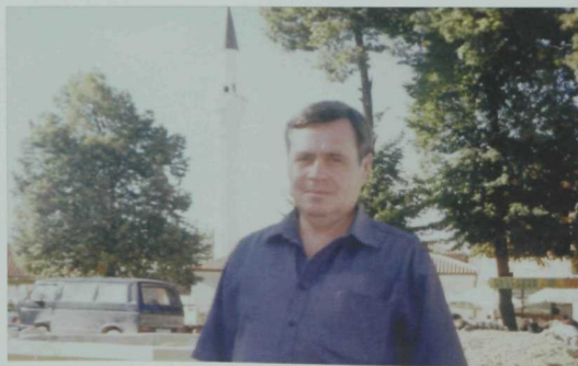
Yazuçı Əxət Muşinskiy Xalıqara Pen-klubnuñ Makedoniədə ütkərelgən Bötəndönya yazuçılar kongressi kənnərendə. Oxrida şəhərə, sentəbr 2002 yıl.