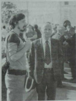
Аталы-уллы Хәкимовлар: шагыйрь Сибгат Хәким, сәясәтче Рафаэль Хәкимов. 80 еллар башы.