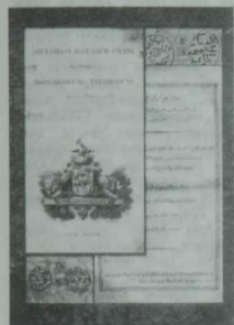
И. Хәлфиннең «Монголлар вә татарлар турында Әбелгази Баһадүр хан тарихы» исемле хезмәте.

И. Хәлфиннең тормышында-язмышында профессор-табип Карл Фукс (1778—1846) белән дуслыгы да зур урын тотта. Аларны һәр икесенең дә һәм тарих белән, һәм телләр белән тирәнтен кызыксынулары берләштерә. К. Фукс үзен татар, чуваш, мордва халыкларының тормыш-көнкурешен фәнни дәрәжәдә өйрөнүчә галим итеп таныта. Ул чувашларның тарихын, горөф-гадәтләрен, йолаларын тикшеренү өчен махсус рәвештә чуваш телен өйрәнә. «Татарлар,—дип яза ул,—минем игътибарымны бик тиз җәлеп иттеләр. Мин аларның дини йолаларын, бәйрәмнәрен, горөф-гадәтләрен һәм гаилә тормышларын бик тырышып өйрөндәм, шуларны кагазга төшөрә бардым». (Фукс К. Казанские татары в статистическом и этнографическом отношении.—Казань, 1844, стр. 38).