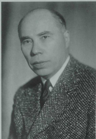
Әхмәт Ерикәй 1902—1967