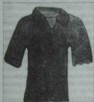
Тимер божралардан «чигелгән» көбә күдмәк. XIX-XV гасырлар

Казан ханлыгы хужалыгының иң алга киткән тармаклары булып, әлбәттә, жир эшкәртү, терлек үрчетү, урманчылык, балыкчылык, умартачылык, һөнәрчелекнең төрле тармаклары—тире эшкәртү, ювелирлык, тимерчелек, чүдмәкчелек саналган; эчке һәм тышкы сөдә (халыкара сөдә) киң жәелә—XV гасырның Венеция сөдәгәре Иосафат Барбаро болай дип язып калдыра: «Казан—сөдә шөһәре; аннан Мәскәүгә, Польшага, Пруссиягә, Фландриягә күпләп тире-мех чыгаралар. Мехны төньяктан һәм төньяк-көнбатыштан дзагатайлардан [бортаслардан?] һәм Мордовиядән китертәләр». Ә менә Казан ярминкәсен шулай ук «Казан тарихы»ның авторы ничек сурәтли: «На той же день [24. 06. 1505] съезжахуся в Казань [на Гостинный остров на Волге] изо всея Руския земля богатии купцы и многие иноземцы далныя и торговаху с Русью великими драгими товарами».