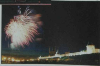
Н. Исмаги́лев фотолары.