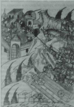
Иван Грозный гаскәрләренәң Казанны камау күренеше. Урта гасыр миниатюрасы.

«...И когда город очистили, В нее сам самодержец наш выехал... Он приехал на площадь великую, У царева двора с коня доброго Соскочил, удивляясь бывшему... Не напрасно казанцы противились И сражались со славою до смерти, Ибо царство сие стоит этого! И вошел он во двор, в сени царские, И пошел в златоверхие теремы, И палаты, любуясь, осматривал, Хоть была красота их разрушена От стрельбы непрестанной от пушечной...»