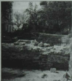
Казан Кремлендә казу эшләре алып барылган биләмә. Казан ханлыгы чорындагы таш бина калдыклары.