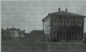
Иж-Бубый кызлар мәдрәсәсе (дарел мөгалимат) 1908—1910 еллар

вакытта ук,—дип яза Г. Бубый,—без кызлар мәктәбен дә ислах кылырга керештек. Һәм туганым белән икәүләп, шул кызлар мәктәбенә кайбер дәресләргә дә керә башладык. (Гажәп факт: XIX гасыр азагында, кызларны уку-язуга өйрәтү дә хәрәм саналган заманда, ике яшь мулла, кызлар мәктәбенә кереп, дәрес бирә! Бу халнең кечкенә бер татар авылында булуын да онытмыйк! Мондый манзараны күз алдына китерү дә кыен!—А. М.) . Эткәй боларның һичберсенә каршы тормады, киресенчә, безне хуплады, безгә рәхмәтләр укыды, догалар кылды. Вә шушы максатны искелеккә каткан вә һәрбер искене, хәтта иске киёмгә каләр, изге санаган муллардан яклады».