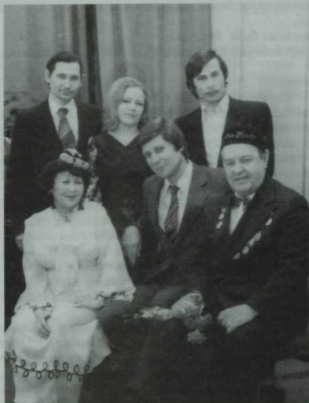
Сәхнәдәшләр һәм остазлар арасында.

М. Г.: Бу жәһәттән исемле, абруйлы жырчы үз остенә зур жаваплылык ала. Охшатып жырлау—кеше күнеленә, хискә бәйле гәмәл. Кемнедер Салаватнын, йә