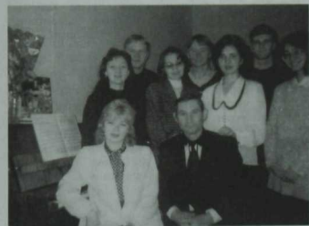
Остаз һәм аның шәкертләре

Шәкертләре дә сынатмыйлар. «Татар жыры», «Казан сандугачы», «Ягымлы яз», «Студентлар язы» кебек