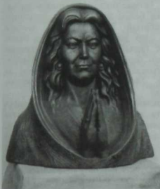
XX йөз алаһесе (бронза).

Үзенә каһарманнарына сәнгатькяр һич тә бер үк төрле кыяфәт бирми, бәлки, һәркайсының төп сыйфатларына басым ясыя, аның эчке байлыгын, рухи дөньясын мәнгеләштерә. Шушы унайдан милли мәдәниятебезгә исциткеч зур өлеш керткән гали затларның сыннарына күз салыяк. Ш. Мәржани, әлбәттә, ин әүвал—имам: башында—чалма, өстендә—яшел чапан, бер кулында—дисбе, икенчесендә—