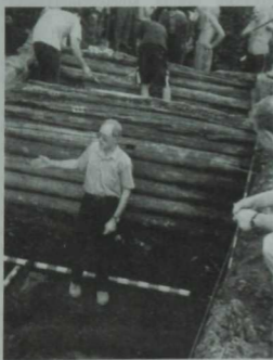
Археологик казу эшләре вакытында

Май аеннан башлап октябрьгә кадәр экспедициядә. Шәһәрлекнен үзендә казулар, аның тирә-юнендә яисә Чирмешән буйлап язын-көзен разведкалар үткөрелә. Һәм янадан-яна ачышлар. Биләр дә шул кадәр бай археологик истәлек булып, болгарларның монголларга кадәрге тарихын янабаштан язарга мөмкинлек бирердәй материал туланыр дип Альфред Хасановичның да башына килмәгәндер, мөгаен. Идел бие мөселманнарының иң борынгы, Ибн Фазланнар чорына караган жөмийгә мәчете, аның янында гына ханнар зираты, көрван-сарай хәрәбәләре. Боларны тикшерүдә Фаяз Хужин да актив катнаша. Ә шәхсэн үзе житәкчелек иткән казылмаларда килеп чыккан һәм болгар археологиясендә әле һаман да бердөнбер исәпләнгән юрта калдыклары, бизәнү әйберләре ясаучыларның остаханәсендә табылган 6 килограмм чамасы гәрәбә, олуг кенәз Всеволод Зур Ояның кургаш мөһере, чүлмөк тоткасына уеп төшерелгән рун язмалары... Санный китсән, бик күпкә жыела алар. Борынгы каланы уратып алган биш катлы саклау ныгытмаларын да Фаяз Хужин бик жентекләп тикшерә һәм туллаган материаллары нигезендә Олуг шәһәрнен тарихи үсешендәге төп этапларны билгели. 1987 елда Ленинградта (Санкт-Петербургта) зур уныш белән яклаган кандидатлык диссертациясе Биләрдәге 15 еллык казу эшләренә нигезләнгән була.