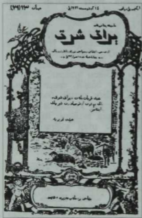
«Ерак Шәрәк» журналының тышылыгы

Мөһажирләр матбугаты башта гарәп хәрефләре белән кулъязма журналлар һәм газетлар рәвешендә дөнья күрә. Аннары шуларны гектография һәм литография ысулында күбәйтәләр. Заманча типография корырга теләкләре булса да, мөһажирләрнен монын өчен шактый вакыт матди мөмкинлекләре булмый.