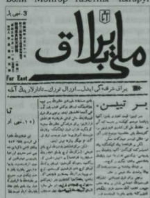
«Милли байрак» газетсы

Тарихта якты истәлек калдырган күренекле татар эшмәкәре Әхмәт Вәли Мөнгәр газетны чыгаруга зур матди ярдәм иткән.