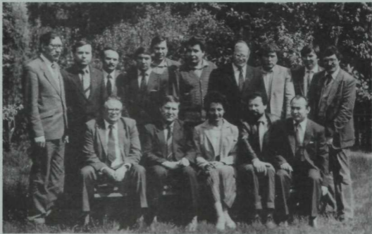
Чувашстанда узган (өештыручысы Г. Рәхим, алгы рәттә, сулдан икенче) татар, башкорт, чуваш ышь шагыйрьләре семинарында. 1985 ел.

Авылда, бөләкәй өстәлдә, тимер шарлы бильярдта уйнап өйрәнгәннәр зур шарлы бильярдта да шәп уйныйлар. Ә инде капылт кына зур шарлы бильярдта өйрәнгәннәр, барыбер остарып житә алмыйлар, “ана сөте белән кермөгәнә” күренеп тора. Машина да шулай ахрысы, ана бөләкәйдән үк ябышып үсәргә кирәктер.