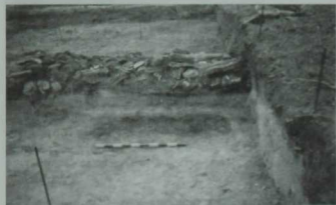
XVII гасыр ахырында төзелгән таш стена калдыклары.