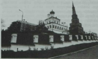
Сөембикә манарасы һәм Нурәли мәчете

Биредә бик борынгыдан ук ниндидер манара булган, әлбәттә. Монысы—бәхәссез. Чөнки аның урыны шундый—стратегик яктан караганда Кремльнең функциясе биредә ниндидер бер күзәтү манарасы булуны таләп итә. Ләкин бүгенге манаранын борынгы корылма булуы—әлегә тулысынча исбат ителмәгән. Фаразлар күптөрле. Бүгенге Сөембикә—бәлки Казан ханлыгы чорында булган манаранын күтәртелгән, реставрацияләнгән вариантыдыр. Элек аның бәлки бер яисә ике ярусы гына булгандыр.