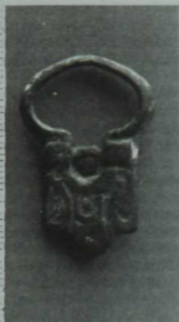
Болгар каеш прәшкәсе (X гасыр ахыры).

дөрөс булуына инандым. Алай гына да түгел, «безнең бабаларыбыз Кремль тирәсендә элгрәк тә яшәмәделәр микән?» дигән яна караш та формалашты.