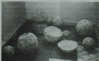
1552 елгы янгын катламыннан чыккан таш ядрәләр.

Археологик казулар вакытында табылган экспонатлар кайда туплана, кемнәр тарафыннан өйрәнелә һәм киләчәктә аларны кайсы музейларда күрергә мөмкин булчак?