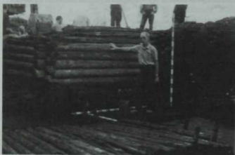
Кремль тавы итәгендә ачылган борыңгы урам (Ханлык чоры).

Ф. Х.: Рәхмәт. Йомгаклап шуны әйтәсем килә: Казан—Татарстанда бердәнбер борыңгы шәһәр түгел. Андый шәһәрләр Казаннан башка да булган. Әйitik, сонгы елларда Алабугада бик кызыклы казу эшләре үткәрелде. Баксан, Алабуга да Казан белән чордаш икән бит! XI гасырда барлыкка килгән! Казанның моннан 1000 ел элек үзе генә яшәве, әлбәттә, гайре табигый хәл булып иле. Алай гына да түгел, Казан һәм Алабугадан да борыңгырак шәһәрләр бар әле. Мәсәлән, Болгар. Ана 1100 яшьне бернинди шикләнүдәрсез бирергә була.