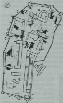
Казан Кремле планы.