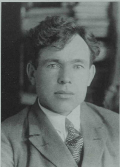
Афзал Шамов 1901–1990