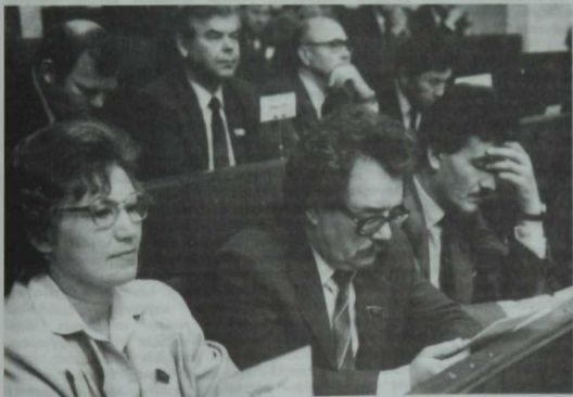
Татарстаннан сайланган СССР Халык депутатлары—Югары Совет әъзалары. 1990 ел.

Съездның беренчесе үк минем уйларымны бутап ташлады. Гомердә ишетмөгән, ишетөргә дә мөмкин булмаган, хөтта тыңларга да куркынын тоелган сүзлөр яңгырады трибунадан. «Өйтөлөргө тиеш түгел» сүзлөргә кул чаптылар. Мин караңгы авылдан зур шөһөр урамына килеп кереп каушап калган малай шикелле, һөрбер сүзнә колак торгызып тыңладым. Бара-тора кыю чыгышлар миңа ошыи башлады. Алар бит минем күңел