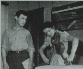
«Беренче мәхәббәт» спектакленнән күренеш