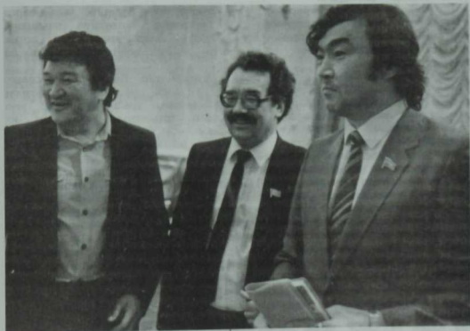
Туфан Миңнуллин СССР Халык депутатлары, казах язучылары Сахен Жунусов һәм Олжас Сөләйманов белән. 1990 ел.

Мин сессиядә чыгыш ясап, автономияләрнең фикеренә бер проектта да колак салынмый дип, съезддагы чыгышымның фикерен дәвам иттем. Минем сүзне яклап, автономияләрдән бүтөн депутатлар чыгыш ясарга тотындылар. Ниһаять, безнең сүзгә игътибар итәргә уйлылар шикелле, белмим, кулга тагын нинди проект тоттырырлар. Һәрхәлдә, өгәр дә безне жирдән-судан мөхрүм итәргә җыеналар икән, автономияләрнең проектны кабул итмәскә көчләре җитчәк, дип өметләнәм.