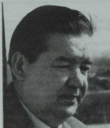
Менә ул татар Зоргесы—Шамил Хәмзин