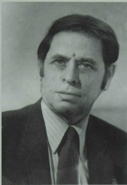
Әбрар Кәримуллин 1925—2000