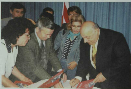
Tənyaq Kipr Terek respublikası Prezidenti Rəuf Denktaş belən oçraşu waqıtında yazuçı Marsel' Gəliev avtograf ala. Noyəbr, 1999 yıl.