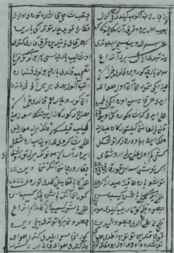
"Кисекбаш" поэмасыннан өзек