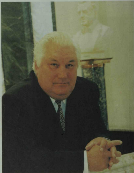
Шагыйрь Мансур Шинапов