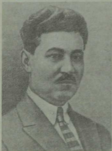
Мәхмүт Галәу. Утызынчы еллар.

Гасыр башында ук кулына каләм алып, халыкка мәгърифәт тарату юлында армый-талмый хезмәт иткән һәм, ниһаять, әдәби әсәрләре, бигрәк тә «Болганчык еллар», «Мөһажирләр» исемле тарихи романнары белән татар әдәбияты хәзинәсенә зур өлеш керткән бу талант иясенә абруйлы исеме һәм иҗат мирасы совет чорында озак еллар буге халыктан яшереп яткырылды. Алай гына да түгел, ул мирасын шактый өлеше тоталитар режим шартларында бөтенләй юкка ук чыкты. Бу яктан Мәхмүт Галәүнең катлаулы тормыш юлы һәм фажигале язмышы утызынчы еллардагы репрессияләр шаукымында нахактан һәлак ителгән татар мәдәнияте эшлеклеләренен күпчелегенен язмышына охшаш.