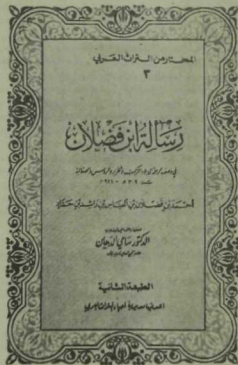
Сүриядә басылган «Ибне Фазлан илчелеге» китабының тышлык бите

бүленгән. һәр баб бер, ике, яисә өч кыска хикәятләрдән тора. Мәсәлән, төржиләр, фарсылар, Бохара, Харәзм, Жәрҗания, Газзия, бәҗәнәкләр, болгарлар, руслар, хәзәрләр турында аерым бабларда сөйләнә. Мондый ысулны куллану китаптан файдалануны тагын да уңышлырак итә.