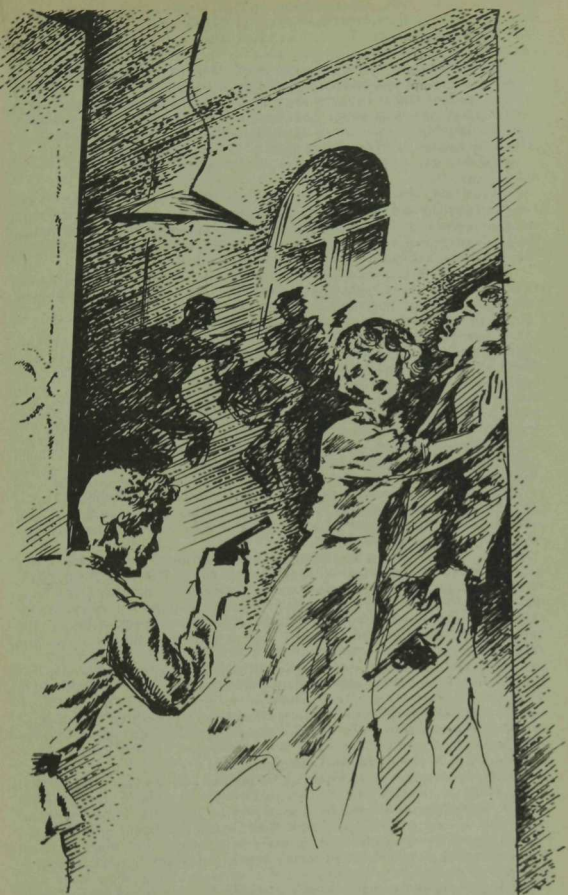
А. Тимергалина рәсеме.