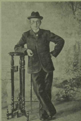
Ф. Әмирхан. 1904 ел. (Матбугатта беренче тапкыр басылган).

Мин аны озатырга дип пристаньга бардым, пароходына мендем. Озатучы кешеләр белән Фатих ага Әмирхан янында булдым. Мин барганда озатучылардан Борһан Бадам-