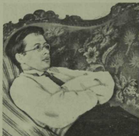
Ф. Әмирхан. 1916 ел, июнь (Матбугатта беренче тапкыр басыла).

Совет чорына Ф. Әмирхан күпмедер дәрежәдә хаталар, адашулар, эзләнүләр аша атлый. Әмма хаталардач тиз айный. В. И. Ленин шулай ди бит: «Акыллы кеше ялгышлар ясамый торган кеше түгел. Андый кешеләр юк һәм булуы мөмкин дә түгел. Бик үк зур булмаган ялгышлар ясап та, аларны жиңел һәм тиз төзәтә белгән кеше акыллы» 1 .