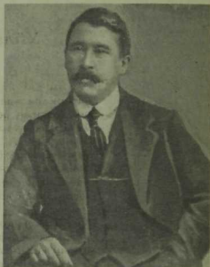
Гарифҗан Мостафин (1884—1972)

Кояш чыкты нур балыкты Тәрәзәдән өйгә аркылды. Уян, шәкерт, ятма йоклап, Уянырга вакыт җитте. Җитәр инде күп йокладык, Чыга алмаслык сазга баттык, Бу сазлыктан чыгу өчен Туды инде зур яктылык. Бик аяныч шәкерт халәң, Бушка әйләнде синең вәлың, Һич файда итә алмадың Исраф булды синең малың, Моңа кадәр гыйлем эзләп, Тирә-якны йөрдең күзләп: Таба алмадың һич нәрсә дә Фәкать акчаң тузды йөзләп. Үлек ташып ашау булды Ашың торган синең ашың. Иске-москы уку илә Катырдылар синең башың, Канча вакыт бушка үтте, Канча гомер җилгә китте. Мондан ары китмәс өчен, Кузгалырга вакыт җитте. Инде хәзер сүз беркеттек, Якты юлдан аерылмаска, Гафләт 1 йортын ташлап китеп, Кире әйләнеп кайтмаска.