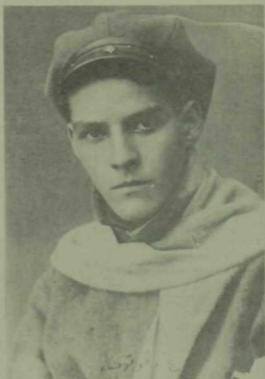
Гадил Кутуй. 1925 ел.

— Әйе, әйе, яңа формасы... Яңа дөньяның, яңа эчтөлөгәнә хәсрәк яңа реализм,— ди-ди сөйләп китте Кутуй. Ашкынып, ялкынланып, үзләренең футуристлар группасына тартып, иптәшлеккә, хәерхәллыккә мине дә кушарга теләгәндәй. Шундый уй башыма килгәң дә өлгөрмәде, Кутуй сөйләүдән тукталып, миңа карап елмаеп куйды да: