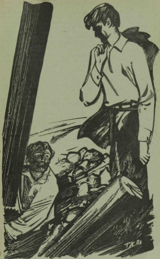
Т. Хажимуратов расме.